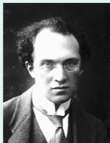
Franz Schreker